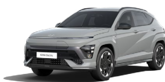
Shadow Grey Speciální pastelová Kombinace s černým lakováním střechy Cena: 17 900 Kč Pouze pro N Line