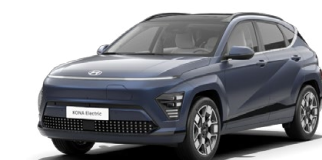
Sailing Blue Perleťová Kombinace s černým lakováním střechy Cena: 17 900 Kč