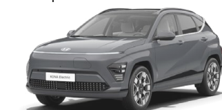
Ecotronic Gray Perleťová Kombinace s černým lakováním střechy Cena: 17 900 Kč